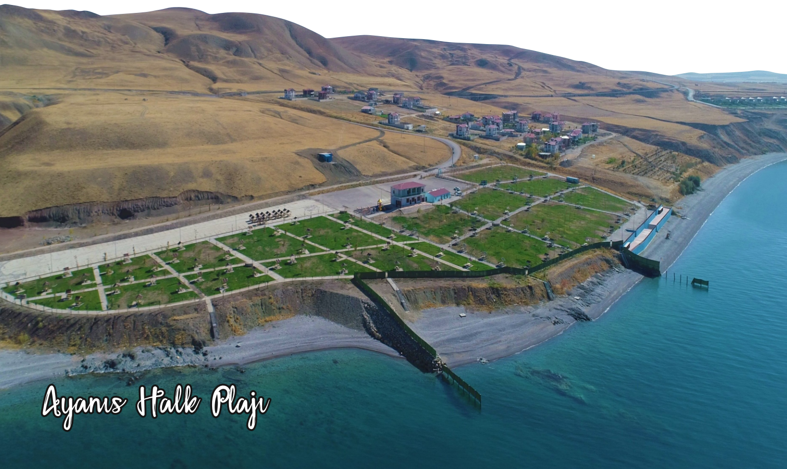
Ayarıs Halk Plajı